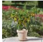
Hot Lemon Zest