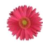
Rose with Light Eye