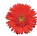
Salmon Rose with Light Eye