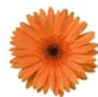
Orange with Dark Eye