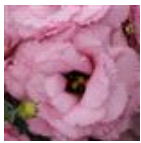
1 Deep Rose