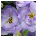
2 Misty Blue