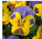
Yellow Blue Jump Up