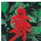
Red Hot Sally II