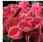
Rose with Edge