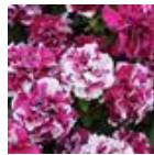
Rose And White