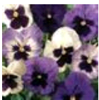
Ocean Breeze Mixture