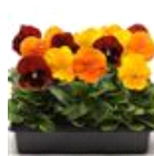
Topaz and Garnet Mixture