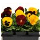
Autumn Blaze Mixture