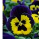
Yellow Purple Wing