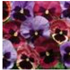
Coastal Sunrise Mixture