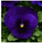
Deep Blue Blotch