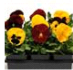
Autumn Blaze Mixture