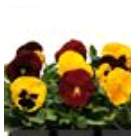
Autumn Blaze Mixture