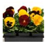
Autumn Blaze Mixture