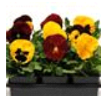
Autumn Blaze Mixture