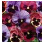
Coastal Sunrise Mixture