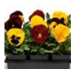
Autumn Blaze Mixture