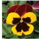
Red Wing Improved