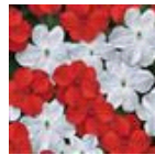
Red White Mixture