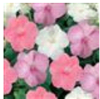
Baby Shower Mixture