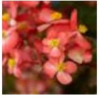
Bicolor Red White