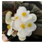
White Bronze Leaf