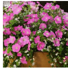
Silk N' Satin