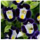
Blue & White