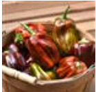
Candy Cane Chocolate Cherry