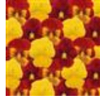
Autumn Blaze Mixture