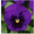
Deep Blue Blotch