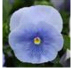
Pure Silver Azure