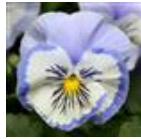
Blue White Whiskers