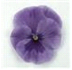
Pure Lilac Shades