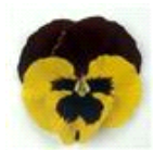
Yellow Red Wing