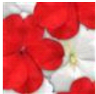
Red White Mixture