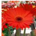
Deep Orange with Dark Eye