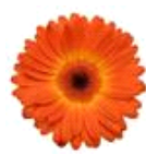
Bicolor Yellow Orange