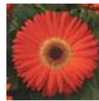
Deep Orange with Dark Eye