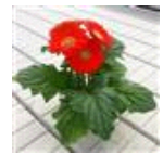
Orange with Light Eye Improved