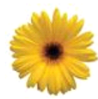
Golden Yellow with Dark Eye