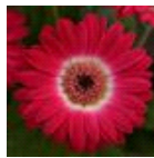
Bicolor Rose White