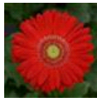
Red with Light Eye