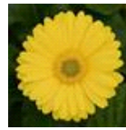
Yellow with Light Eye