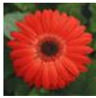
Red with Dark Eye