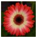
Bicolor Red Lemon