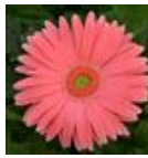
Salmon Shades with Light Eye