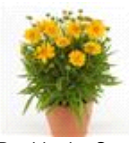
Double the Sun