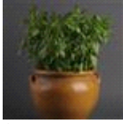
Sweet Dani Lemon