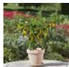
Hot Lemon Zest