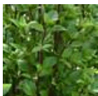
Everleaf Thai Towers