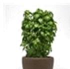
Everleaf Emerald Towers