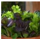
Pro Tatu Mixture