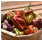
Candy Cane Chocolate Cherry