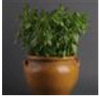
Sweet Dani Lemon