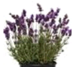
Avignon Early Blue