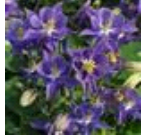
Early Sky Blue