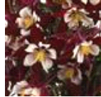
Burgundy And White