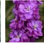
Miracle Blue Mid