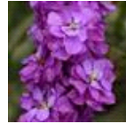
Miracle Blue Mid