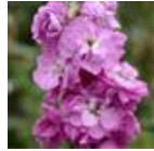
Ball Pink No 22