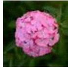
Deep Pink Maxine