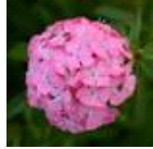
Deep Pink Maxine