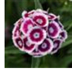
Purple White Bicolor