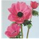
Orchid Shades Improved