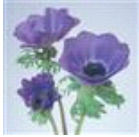
Deep Blue Improved