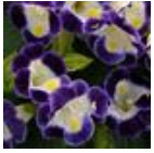
Blue & White