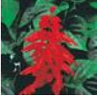
Red Hot Sally II