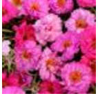
Pink Passion Mixture