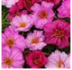
Pink Passion Mixture