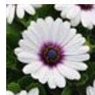
White Purple Eye