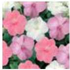
Baby Shower Mixture