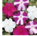
Violet Star Blend