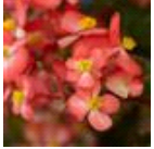
Bicolor Red White