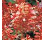
Red And White